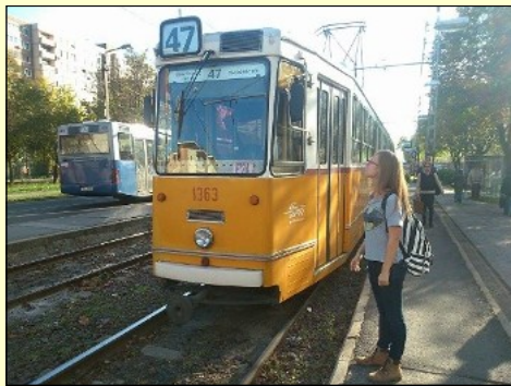
Részlet a bemutatóból